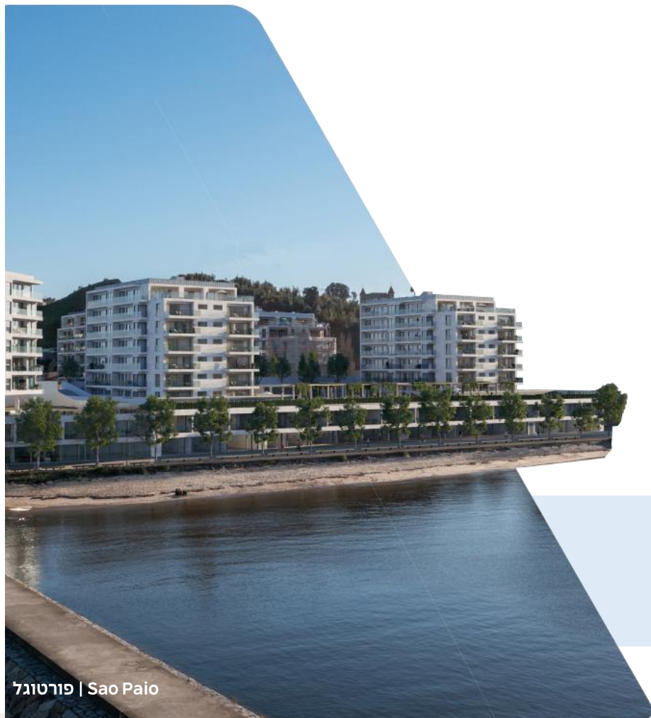
פארטוגל | Sao Paio

מאז שהחלה את דרכה ב-1969 בג'מייקה ובקריביים, החברה ממשיכה להוביל פרויקטים גדולים באמצעות חברות הבת שלה – ממגורים ותשתיות תחבורה ועד נכסים מניבים.