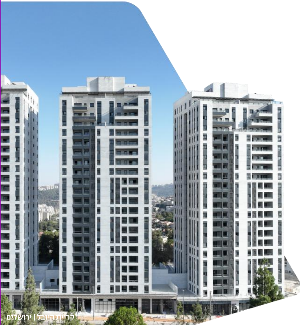
קרית הירובל | ירושלים