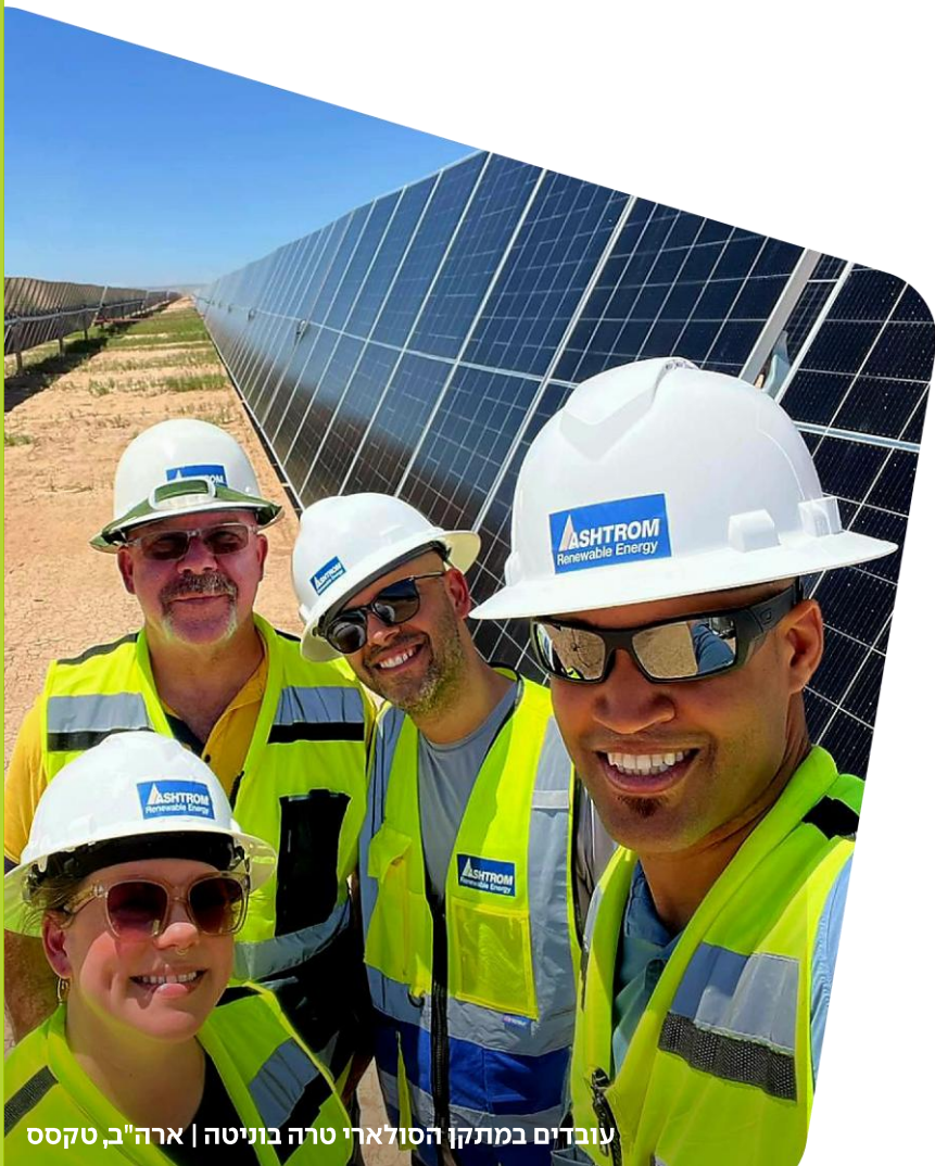
עובדים במתקן הסולארי טרה בוניטה | ארה"ב, טקסס