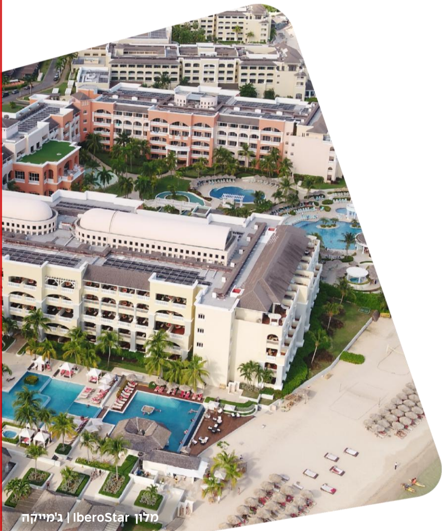
מלון IberoStar | ג'מייקה