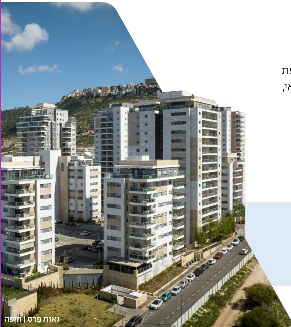
נאות פרס | חיפה